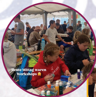
Heute Mittag waren Workshops 🍷