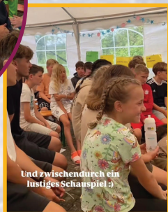
Und zwischendurch ein lustiges Schauspiel 😊